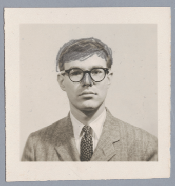
Andy Warhol, Self-Portrait (Passfoto mit retuschierter Nase), 1956