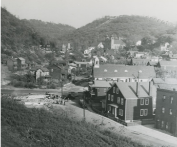
Die Nachbarschaft Ruska Dolina oder Rusyn Valley (russisches beziehungsweise russinisches Tal) in Pittsburgh, 1943. Im Hintergrund erkennt man die Zwiebeltürme der Kirche St. Johannes Chrysostomos, in der Warhol getauft wurde.