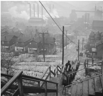
Lange Treppe im Industrieviertel in Pittsburgh, Pennsylvania, 1940 Long stairway in mill district of Pittsburgh, Pennsylvania, 1940