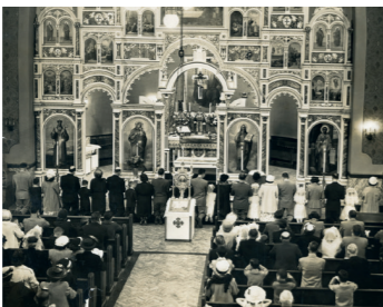
Ikonostase in St. Johannes Chrysostomos in Pittsburgh, der byzantinisch-katholischen Kirche, welche die Familie Warhola regelmäßig besuchte, Datum unbekannt

Immigration to the United States is restricted with a racist quota (Emergency Quota Act): preferential treatment is given to mostly white immigrants from northern and western Europe over those from southern and eastern Europe.